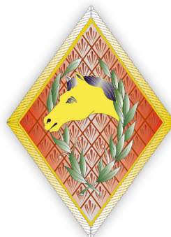
Figura 8. Rombo CSE 2.ª Sección.

Los emblemas del CSE y el de herrador no se publicaron hasta tres años después 26 :