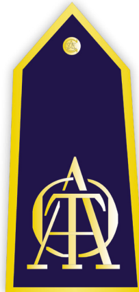
Figura 5. Hombrera Tercera Sección CASE.