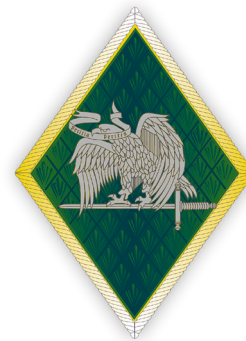
Figura 11. Rombo de especialistas EEJO y EBS.

Para los especialistas se estableció un nuevo rombo-distintivo que englobaba a todos los especialistas, así como el distintivo de especialidad, con un escudo español cuadrilongo 42 . Pero se modificaron un año después, pasando a tener un escudo español redondeado del que pendía una chapita que expresaba la especialidad dentro de la rama a la que pertenecía: VAV para