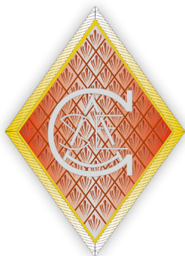
Figura 7. Rombo CASE 1943.

Tenía tres secciones, en ninguna de las cuales aparecían los herradores-forjadores que, como auxiliares de veterinaria, debían haber sido encuadrados en la segunda, junto con los practicantes de sanidad y de farmacia, por lo que continuaron prestando servicio formando parte de la estructura del CASE, con su uniformidad, con los únicos cambios de la aparición de su rombo correspondiente y la sustitución de la corona mural de la gorra por el escudo del Ejército de Tierra.