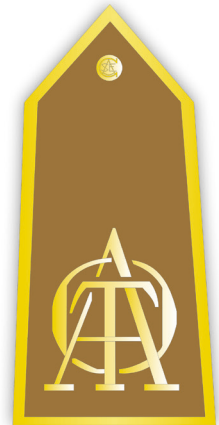
Figura 6. Hombrera Tercera Sección CASE (cuerpos armados).

En las primeras plantillas publicadas aparecieron 732 herradores-forjadores, que poco variaba de la anterior de 1929 16 .