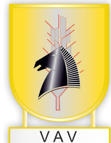
Figura 13. Rama Veterinaria EEJO y EBS año 1977 VAV: Auxiliar de Veterinaria VCC: Cría Caballar.

los Auxiliares de Veterinaria, y VCC para los de Cría Caballar.