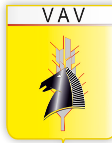
Figura 12. Rama Veterinaria EEJO y EBS año 1975 VAV: Auxiliar de Veterinaria VCC: Cría Caballar.